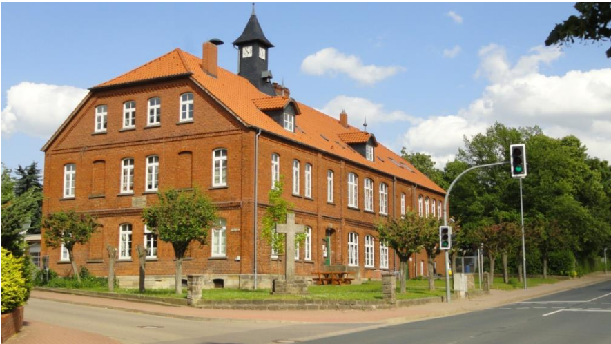
Haus der Heimatstube, dem Ortsmuseum in der Ortsmitte von Bredenbeck, Am Lindenplatz, Wennigser Straße 23